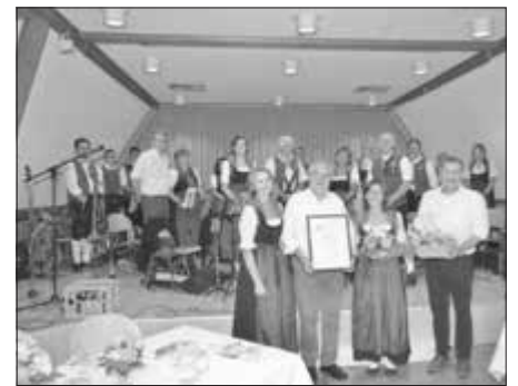
Musikkapelle Röfingen e.V.

musikalischen Karriere und in seinem politischen Wirken als 1. Bürgermeister setzt er sich stets um die Belange des Musikvereines ein und hat sich so in besonderer Weise um die Blasmusik verdient gemacht. Der Musikkapelle war es ein besonderes Anliegen dem Ehrenmitglied und Bürgermeister zu seinem 70. Geburtstag als Wertschätzung für seine Verdienste und als Dankeschön, die Ehrennadel für Förderer in Silber vom Allgäu-Schwäbischen-Musikbund zu überreichen.