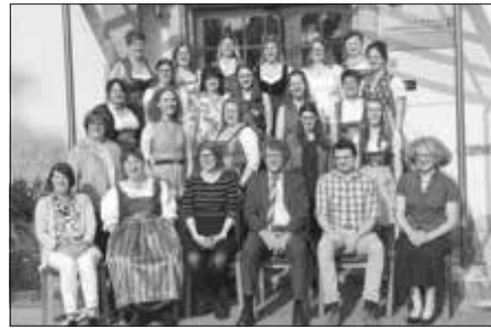
Die stolzen Absolventinnen und ihre Lehrkräfte

Wer jetzt Lust auf „mehr“ bekommen hat, hat Glück, denn für den neuen Teilzeitstudiengang ab September sind noch Plätze frei. Genaueres über Inhalte und Ablauf des Teilzeitstudiengangs erfahren Sie am Infoabend am Mittwoch, 21.06.2023 um 19 Uhr im Amt für Ernährung, Landwirtschaft und Forsten in Krumbach (Schwaben). Um Anmeldung unter gertrud.wenz@aelf-km.bayern.de wird gebeten.