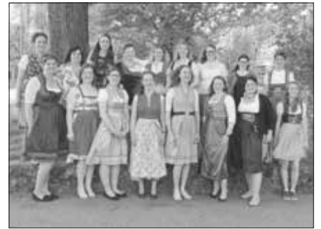
Die stolzen Absolventinnen